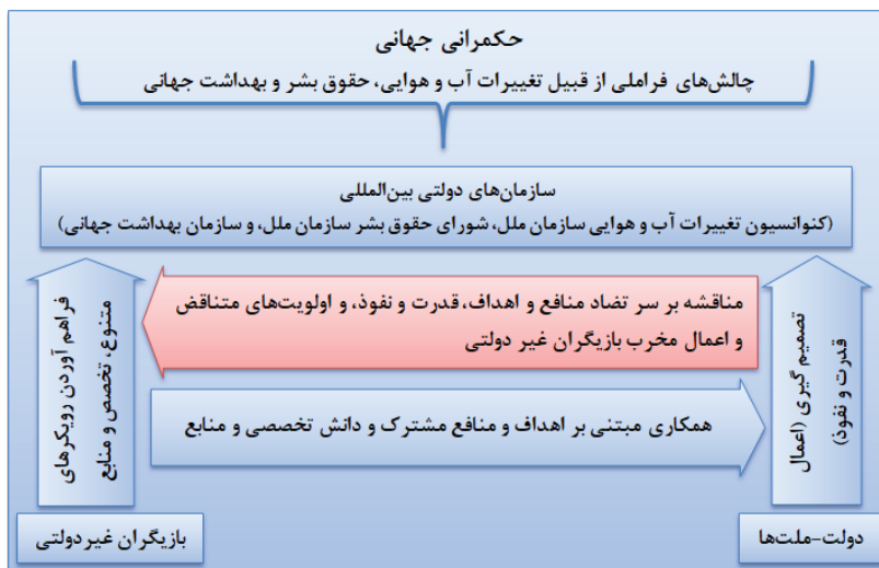
رسم توضیحی ۳: حاکمیت جهانی و مشارکت بازیگران غیردولتی

حکمرانی جهانی به مکانیسم ها، نهادها و فرآیندهایی اطلاق می شود که از طریق آن دولت های ملی و بازیگران غیردولتی به مسائل جهانی در سطح بین المللی می پردازند و بر آن حکومت می کنند. (Woods, 2000) اغلب شامل مشارکت دولت های ملی، سازمان های بین دولتی و بازیگران غیردولتی مانند سازمان های غیردولتی، شرکت های چندملیتی و گروه های جامعه مدنی می شود.